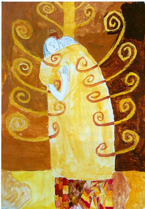
Slika 3: Objem

Na šoli sem izvedla anketo o motiviki v 7., 8. in 9. razredu, skupaj 58 učencev. Zanimalo me je, ali so resnične moje naslednje domneve: