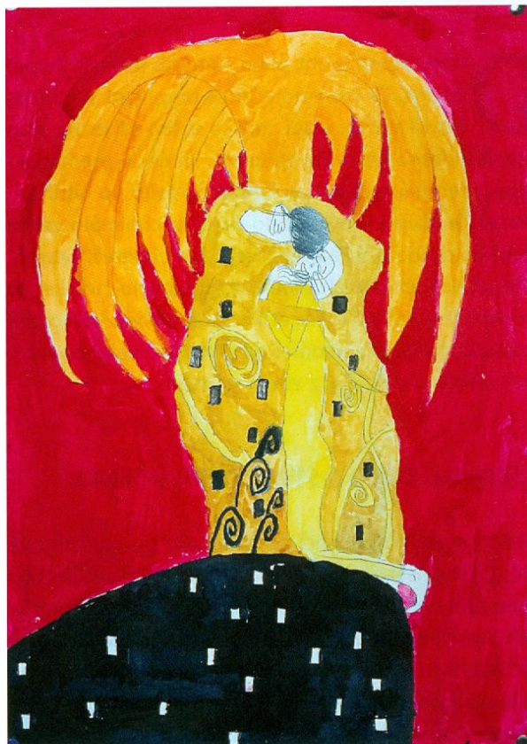
Slika 2: Objem pod drevesom

umetniško delo abstraktno. Abstraktno gledanje umetnine pomeni, da zaznavamo samo oblike, barve, smeri, ritem slike in zanemarimo „zgodbo“, vendar začutimo slikarsko izpoved. Zgodba pa je v likovnem delu tisto, kar je realistično, prepoznavno, se pravi motiv. Če pogledamo motiviko klasičnega slikarstva, v njem ni bilo velike raznovrstnosti. Kot motiv se pojavljajo krajina, tihožitje, avtoportret in skupinski portret, pa morda še žanrski prizori. Slikarji so z enakimi motivi dosegali različne izpovedi, sporočali različna sporočila. Enako delamo pri likovni umetnosti v šoli. Pri tem pa moramo vedeti, da so otroci nasploh, tudi starejši, zelo „navezani“ na motiv, kadar gledajo slike in kadar jih ustvarjajo. Sliko zaznavati abstraktno, brez navezave na motiv, je zanje težka naloga. Zato je pomembno, da izberemo ustrezen motiv za njihove likovne naloge. Motiv mora biti prilagojen likovnemu problemu, ki ga rešujejo, likovnim pojmom, ki jih morajo usvojiti s slikanjem, pa tudi njihovi starosti in interesom. Moja teza, ki je rasla z mojimi izkušnjami pri likovnem delu z otroki vseh starosti v osnovni šoli in ki