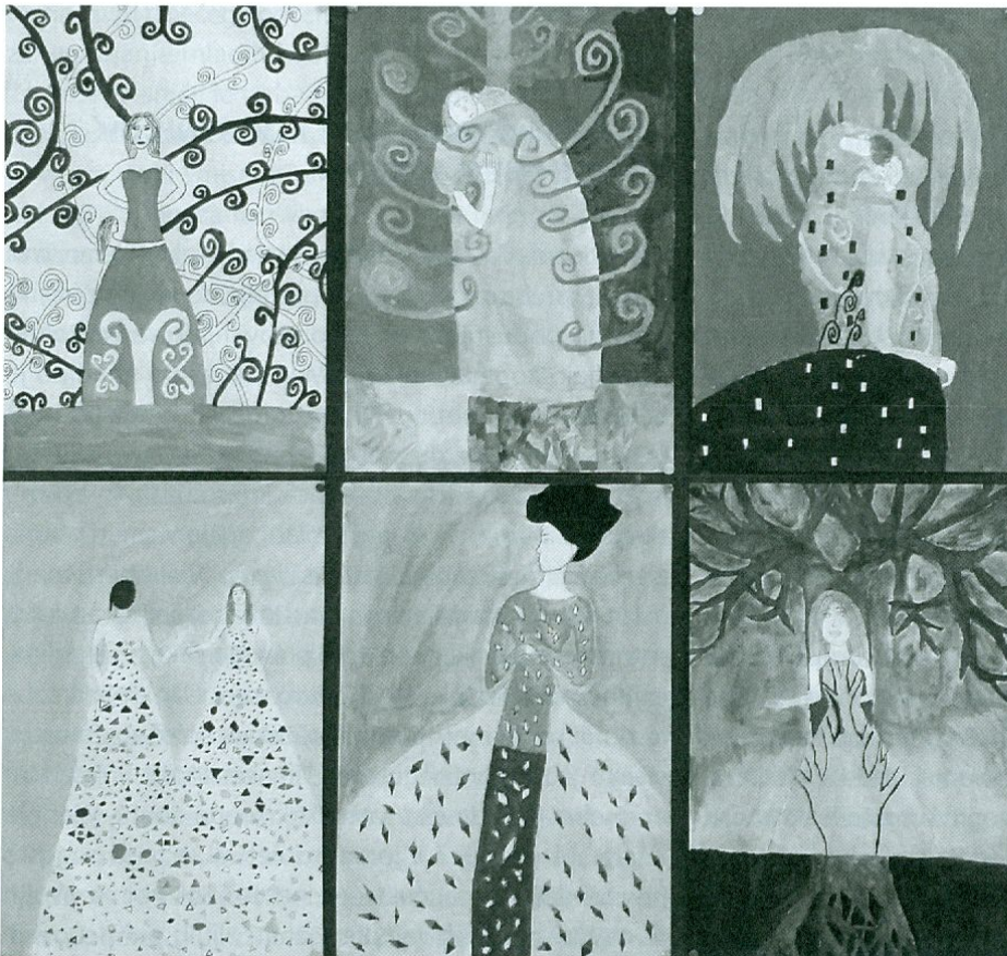
Slika 5: 9. razred po vzoru Gustava Klimta

Velikokrat potem prevladata v celem razredu samo en ali dva motiva – tisti, ki si ga izbere najsamozavestnejši otrok, drugi pa ponavljajo za njim. Zato sklepam, da gre tu bolj za nerodne izbire motivov, kot pa za veliko željo učencev po svobodi, v kateri bi risali, „kar bi hoteli“. Druga težava pri tem pa je, da ne marajo risati nečesa, kar se jim zdi težko. Kot nam je povedala anketa, je to brez dvoma človeška figura ali obraz (portret) ali pa predmeti, ki imajo veliko podrobnosti in prostorskih momentov. Vendar je to samo strah pred neuspehom ali pa lenoba in želja po hitrih rešitvah. Če to uspemo nekako premagati in jih prepričati, naj rišejo tisto, kar imajo radi, smo zmagali. Pri risbi se bodo veliko bolj potrudili, ker jim predmet upodabljanja nekaj pomeni. Pa tudi bolj kritični bodo do upodobitve in ne bodo zadovoljni z vsako rešitvijo.