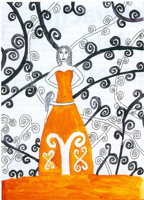
Slika 1: Drevo

šnjem času ne pušča brezbriznih. V njihovem predstavnem svetu prevladujejo svetovi, junaki in dogajanje iz digitalnih „kraljestev“. Pravi junaki pa so zanje tisti, ki te svetove obvladujejo, you-tuberji, igričarji, hekerji... obvladovalci digitalnega sveta. Drugačni junaki kot včasih. A vendar, vrednote, za katerimi stremijo naši mladostniki, so morda enake kot vrednote mladih vseh časov. Želijo biti sprejeti, želijo biti pomembni, želijo biti nekdo. Pustimo ob strani vprašanje, ali so današnja internetna junaštva res to, kar mladi iščejo, in ali so spletni mediji pravi medij za prevajanje jezika vrednot. Pomembno je, da prepoznamo v mladih tisto vsebino, ki se želi po medijih izraziti.